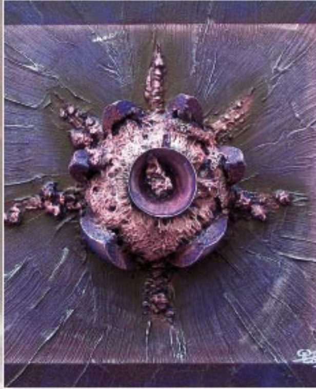
GABRIEL BUR, ZEITFANG 2005

Gabriel Bur über sein Schaffen: „Meine Arbeiten entwickle ich aus einer sehr individuell erarbeiteten Plastizität des jeweiligen Materials, wobei sich das Thematische des Konzeptes seine Materialien und Farben selbständig für das Werk sucht. In der Spontaneität des Schaffens werden oft alltägliche Gegenstände und Materialien in das Werk eingebunden, um sowohl das Konzept als auch den Charakter des Bildes zu gestalten. Dem Betrachter soll viel Raum für die eigene Interpretation verbleiben, um eine gewisse Identifikation mit dem Bildwerk zu entwickeln.“